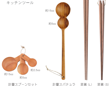
計量スプーンセット